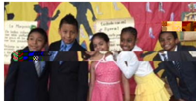
Estudiantes de Lenguaje Dual de la Escuela Primaria Cleveland