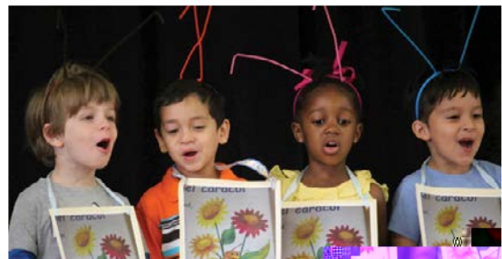
Estudiantes de Lenguaje Dual de la Escuela Primaria Bancroft

Un programa de Lenguaje Dual proporciona a los estudiantes al menos 50 por ciento de su enseñanza en otro idioma. En las EPDC, actualmente ofrecemos programas de Lenguaje Dual en Español en 11 escuelas. El currículo está diseñado para que la enseñanza en español desarrolle la enseñanza en inglés y viceversa. Los estudiantes que completen nuestros programas de Lenguaje Dual o Dos Idiomas serán bilingües y estarán alfabetizados en los dos idiomas, a la vez que también lograrán éxito académico y competencia cultural.